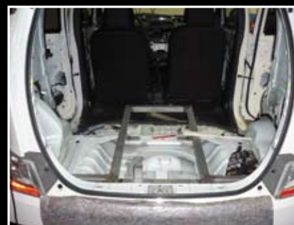
Après démontage des garnitures, une structure en acier est fixée sur le châssis de la Materia.