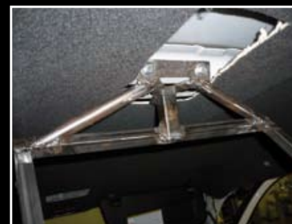
La partie haute de la structure est boulonnée sur les traverses du toit pour renforcer la solidité du système.