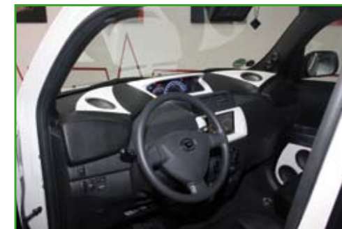
Tout en respectant le style d'origine, Dennis a refait le dessus de la planche de bord pour bien positionner les médiums indispensables à une bonne image sonore.

l'avant du rack entre les deux sièges baquets avant. Une illumination par leds vertes, Dietz, assure la finition et l'ambiance à la "Matrix". Les dossiers des baquets ont même été remoulés pour recevoir des écrans SAVV de 7". Pour les voies principales, médiums/aigus, Dennis a encore sorti le grand jeu. Les extrémités du tableau de bord ont été remoulées à l'aide de fibre pour y loger deux médiums de 13 cm... histoire d'avoir un bon positionnement de l'image sonore. Chaque montant de pare-brise reçoit pour sa part une paire de tweeter... moulé dans le revêtement.