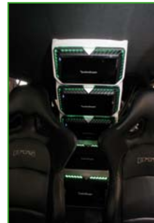
Ces amplis Power sont très compacts, mais délivre une puissance redoutable !