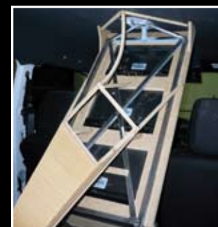
Cette même partie va accueillir les six amplis dans un décor fait de MDF et de fibre.