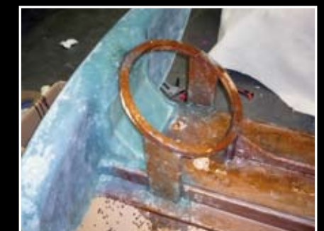
La structure du caisson de grave est classique. Elle est réalisée en MDF, fibre et résine.