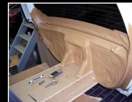
Ce coffrage en MDF dissimule le mécanisme et servira de base au caisson de grave du hayon.