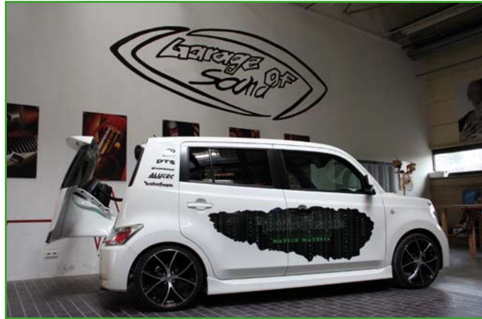
Dans la déco à la Matrix, on peut lire les lettres Rockford Fosgate. Classe !

Une structure en profilé d'acier a été boulonnée puis soudée au plancher de l'auto. Le décor et les caissons de grave ont eux été réalisés à base de fibre et de MDF. Mixant une finition cuir noir et fibre peinte couleur carrosserie, l'habitacle nous plonge dans une ambiance très high-tech. Celle-ci est renforcée par les nombreux écrans SAVV, qui diffusent le symbole de la Matrice, et par les étranges "tuyauteries" qui véhiculent le flux de watts aux subwoofers. Cet immense coffre en accueille trois dont un sur le hayon motorisé et une paire de coaxiaux qui assure l'ambiance sonore dans les salons comme sur les meetings. Les six amplis de l'installation sont montés à