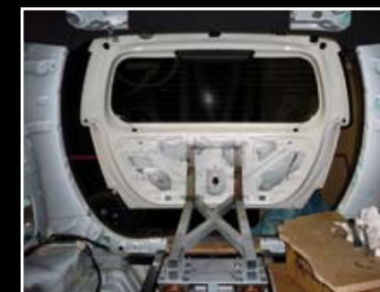
La partie basse de la structure métallique supporte la motorisation assurée par un vérin électrique qui pousse ou tire le hayon.