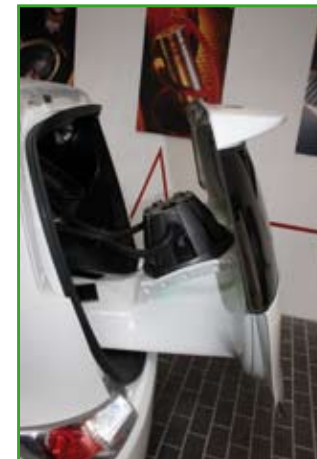
Le plus gros du travail a été de confectionner un hayon motorisé.