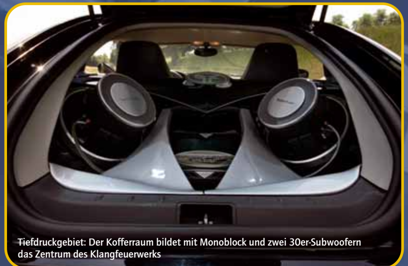
Tiefdruckgebiet: Der Kofferraum bildet mit Monoblock und zwei 30er-Subwoofern das Zentrum des Klangfeuerwerks