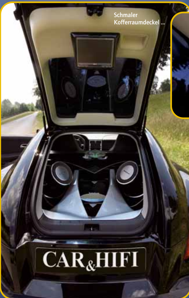
Schmäler Kofferraumdeckel ...