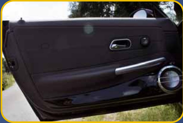
Lackierte Doorboards fügen sich nahtlos in die Fahrzeugoptik ein