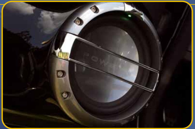
Hier arbeiten leistungsfähige 16er aus dem T162s

lackierte Spitze. Für die Hochtöner wurden die Originalblenden genutzt, die Halterungen mit GFK modifiziert und dann lackiert. Die Kofferraumkonstruktion ist aufwendig: Auf einer Grundplatte sitzen sechs GFK-Elemente, darüber eine schwarz lackierte Brücke, die der Form der Stoßstange nachempfunden wurde. Die beiden P3D212 Subwoofer wurden mit den Magneten nach außen eingebaut und machen in zwei geschlossenen 30-Liter-Gehäusen richtig Druck. Als zusätzlichen Hingucker installierte Dennis in der schmalen Kofferraum-