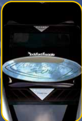
Grün hinterleuchtetes Logo als optisches „1-Tüpfelchen“