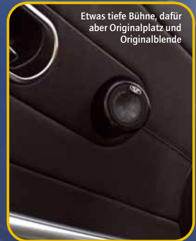
Etwas tiefe Bühne, dafür aber Originalplatz und Originalblende

Bei schönstem Sommerwetter heißt es: Türen und Kofferraumklappe zu und die „Transformers“-DVD in den Schacht. Und schon geht's im Crossfire richtig ab. Die Paramount-Sterne zu Beginn bringen einen interessanten Effekt und schwirren um unsere Köpfe herum. Wir zappen bis zu einer Ballerszene und stecken plötzlich mitten in einer Schießerei. Es wummert, kracht, knallt und pfeift uns um die Ohren. Bei der Landung der „Autobots“ macht sich bemerkbar, wie viel Tiefgang die beiden Woofer haben. Ordentlicher Stoff. Sie meistern auch allertiefste Sequenzen mit Leichtigkeit und haben bei sehr hohem Pegel noch