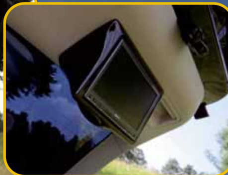
... mit SAVV-Monitor für das Publikum draußen